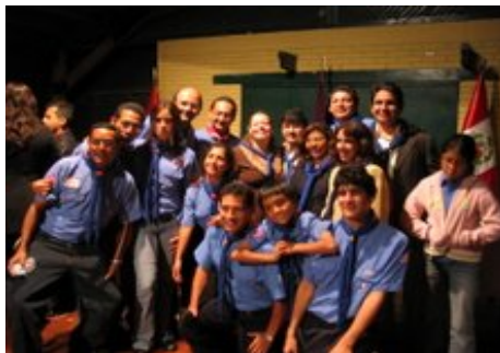
Jefatura - Grupo Scout Magdalena 30

También son bienvenidos los Grupos Scouts reactivados: CHIMBOTE 83, INDEPENDENCIA 377, LIMA 73, LINCE 70 y MAGDALENA 34.