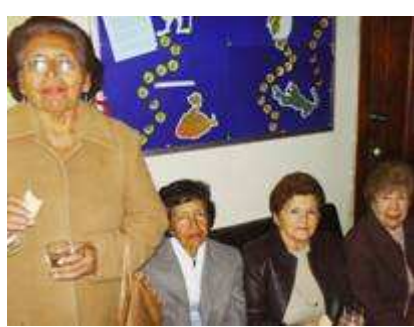
Las AMAS scouts siempre presentes