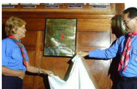
Develación de placa del grupo La Molina 1