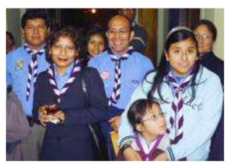
...y también muchas delegaciones.