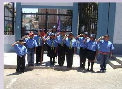
Fogata Scout a la Virgen Inmaculada

Nuestros hermanos de Moquegua, nos escriben contándonos de las diversas actividades que vienen realizando en su localidad. Es por ello, que nuestro hermano dirigente y encargado de la localidad de Moquegua, nos informa de la participación de los scouts en el CXIV aniversario del distrito Samegua, así como de la fogata a la Virgen Inmaculada Concepción.