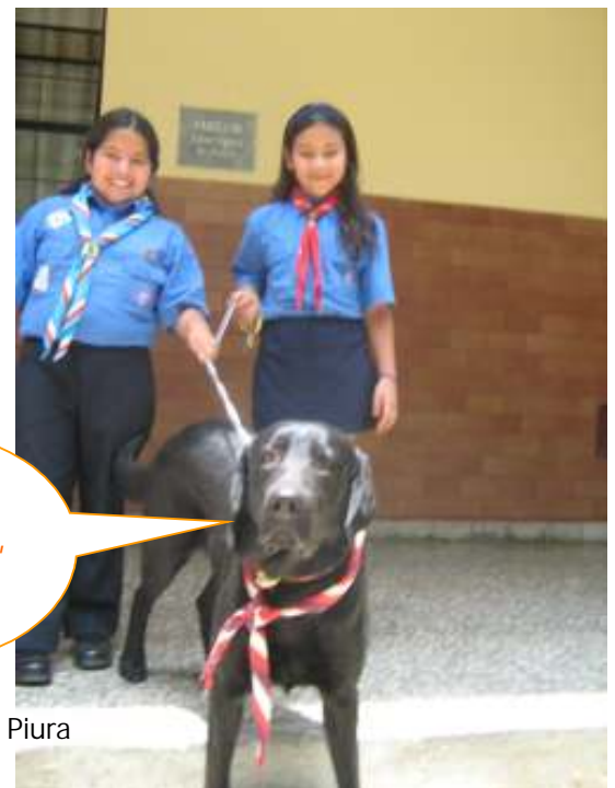
Bagueera de Piura

Envíen sus colaboraciones a: infoscout@scout.org.pe