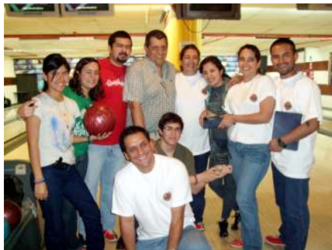
El equipo ganador y su flamante campeona.