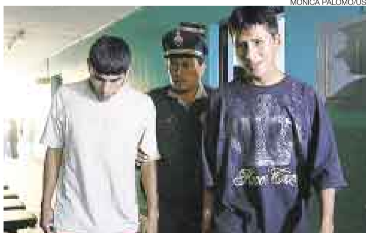
ACUSADOS. Los barristas permanecieron en la comisaría de Vitarte hasta ayer a las 3:30 p.m. Luego pasaron a la fiscalía penal de Santa Anita.